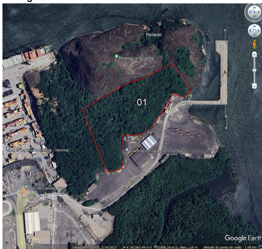
Figura 4: Monumento Natural Morro do Penedo