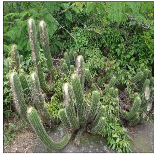
Fauna e flora.