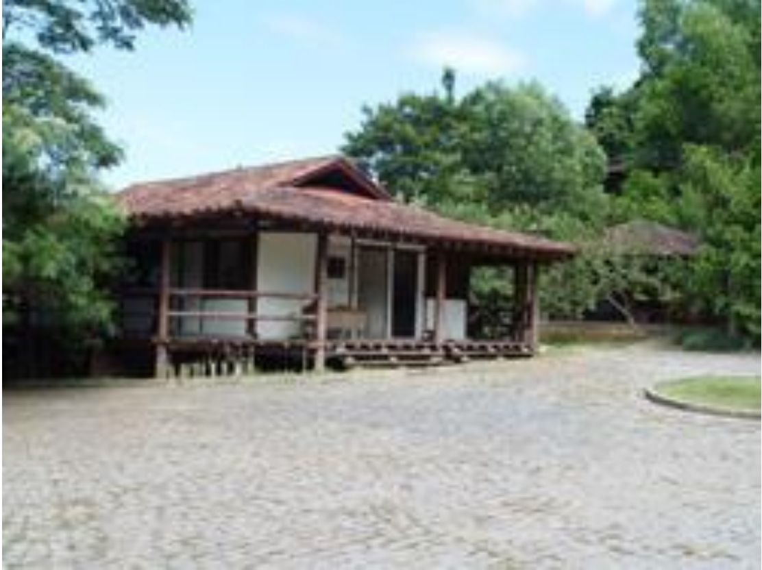
Sede Administrativa e Centro de Atendimento aos Visitantes do PNMMM

Permanece aberto para visitaç o de segunda a domingo, das 8h  s 17h.