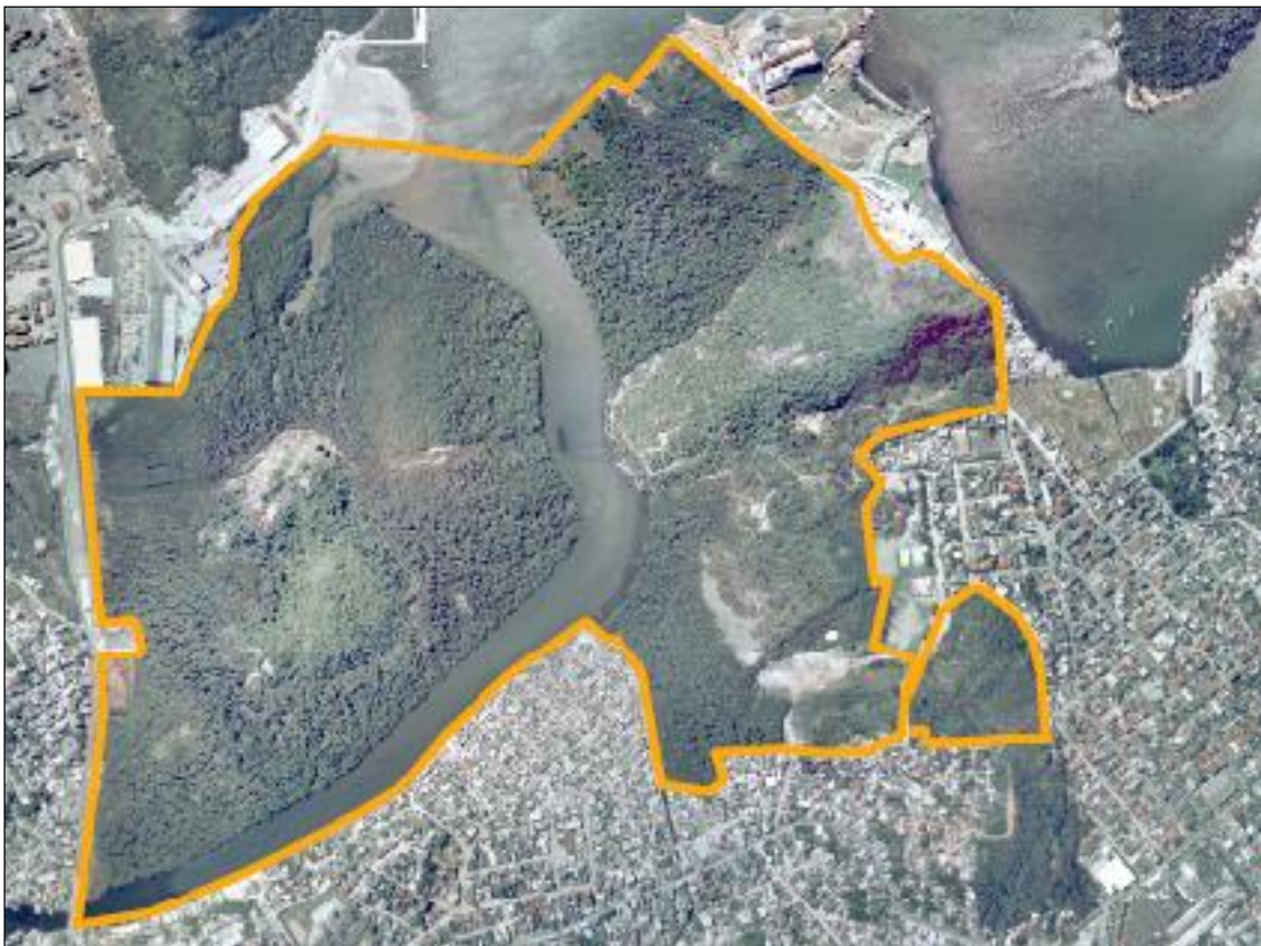
Limites do PNMMM

Apesar de estar localizado em uma área urbana, o Parque abriga rica e variada fauna. Aves, anfíbios, além de répteis como o Teiú e a Jibóia, e mamíferos como o Sagüi-da-cara-branca, morcegos e gambás.